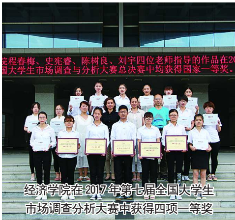
经济学院在2017年第七届全国大学生市场调查分析大赛中获得四项一等奖