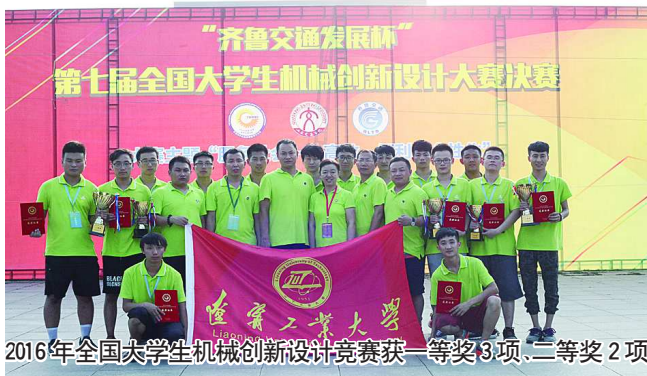
2016年全国大学生机械创新设计竞赛获一等奖3项、二等奖2项