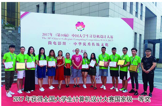
2017年获得全国大学生计算机设计大赛国家级一等奖