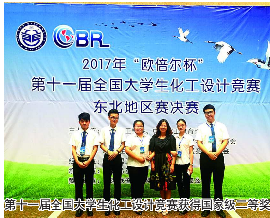
第十一届全国大学生化工设计竞赛获得国家级二等奖