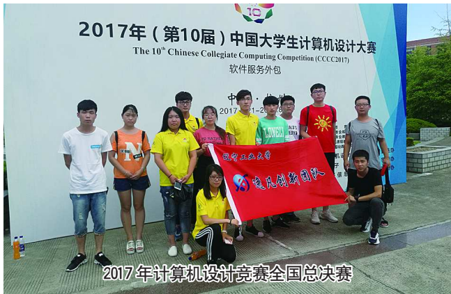
2017年计算机设计竞赛全国总决赛