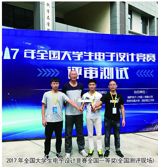
2017年全国大学生电子设计竞赛全国一等奖(全国测评现场)