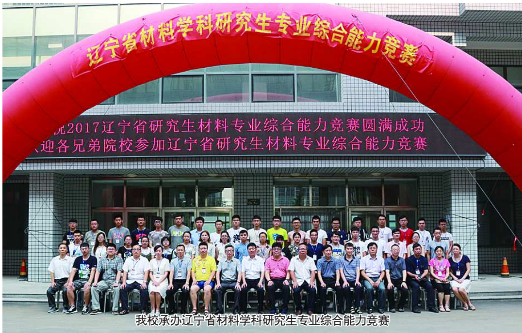
我校承办辽宁省材料学科研究生专业综合能力竞赛

想、练本领，敢担当，“敢于有梦、勇于追梦、勤于圆梦”。有在国内外科技竞赛中求新探异、崭露头角的“创新新秀”，有获得知名企业青睐的“技术达人”，有矢志创业、实现梦想的“创业之星”，有响应国家召唤、到西部、下基层建功立业的“热血青年”，更有许许多多由各位同学为主角书写的青春故事，校园传奇。