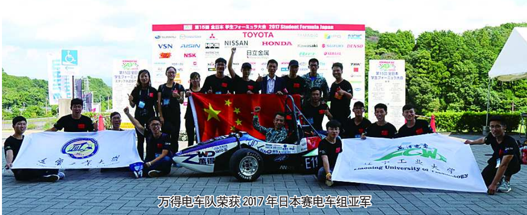
万得电车队荣获2017年日本赛电机组亚军