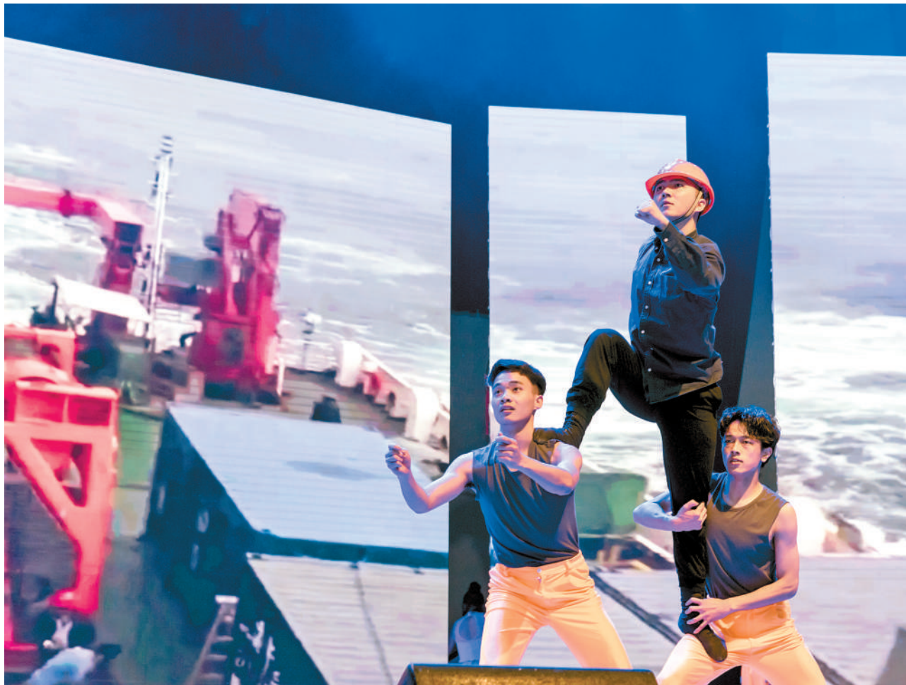
6月8日晚,艺术学院2018届舞蹈系毕业生们用编排精湛的舞蹈《海洋心,我的中国梦》再现“海牛之父”万步炎先进事迹。舞蹈以万步炎及其团队研发“海牛”的事迹为原型,再现万步炎在海上工作的壮美场景,用铿锵的舞步彰显“海牛”团队挺进深海的决心,用最美的舞姿跳出一支振奋人心的“海牛”之舞。

▼6月7日,数学与计算科学学院举办“学术活动月”,邀请了国内外10位知名专家来校围绕学术前沿及热点问题,为师生做了十场精彩纷呈的学术报告。(唐春燕)