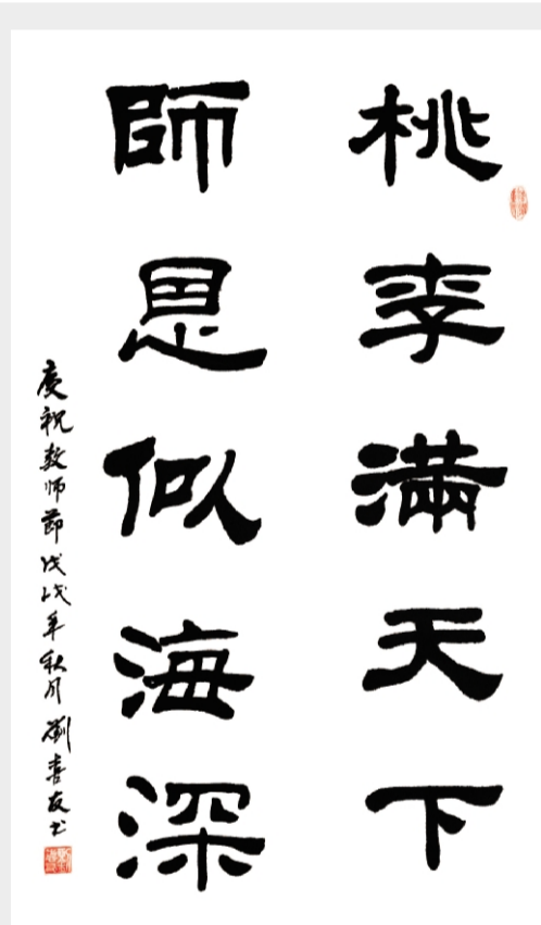
▲ 刘喜友/作 陈绘兵/作 ▶

四季的风从家乡吹过,山村呈现出了不同的华章。风儿沙沙,吹过了山岗,吹过了黄土高坡,吹进了我的梦。那故乡的山,那故乡的云,为我拂平心中的创伤。