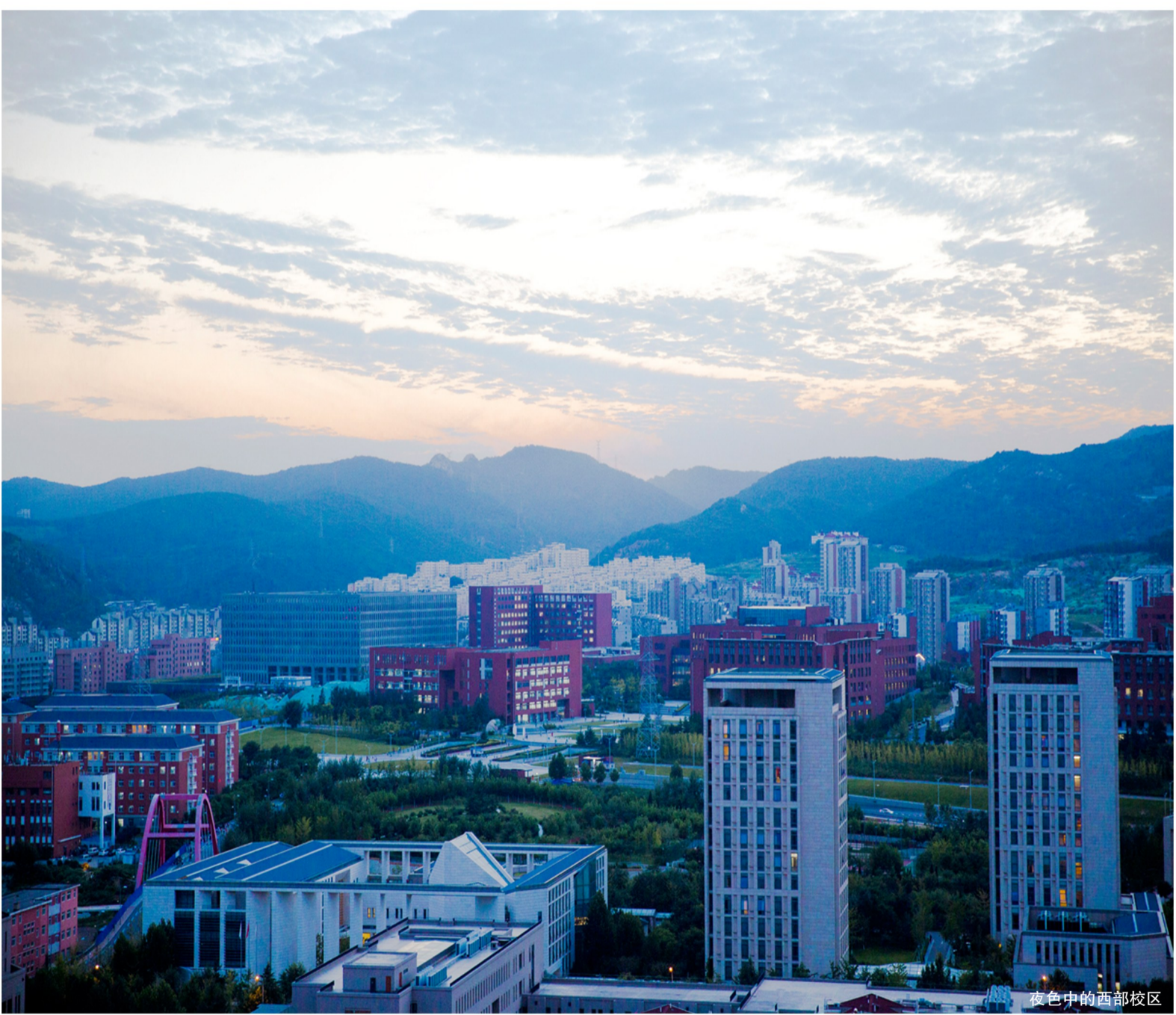
夜色中的西部校区