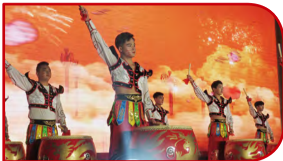
开场歌舞《共创辉煌》