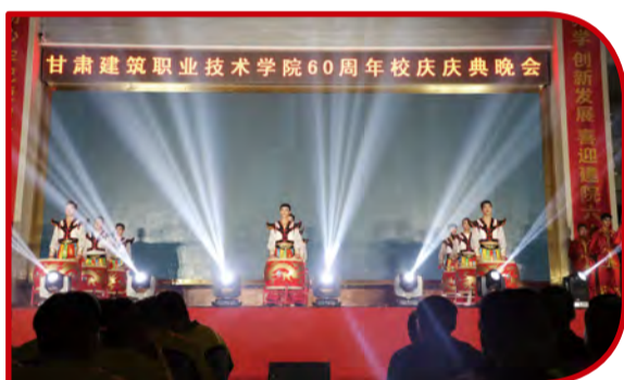
开场歌舞《共创辉煌》