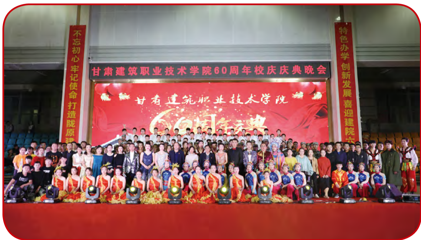
学院领导与演职人员合影

作为中华建筑业鼻祖——有巢氏的传人，经过几代人的不懈努力，汇聚成一股助推学校进步的强大力量，为今天建院的跨越式发展积淀的深厚的文化精神底蕴，奠定了坚实的办学基础。在学院60周年校庆来临之际，学院师生共庆60华诞，于10月19日晚上演了精彩纷呈的文艺晚，为广大师生奉送上了“精神大餐”。