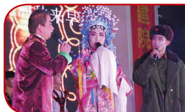
开场歌舞《共创辉煌》