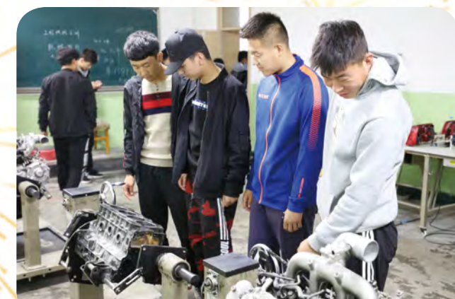
学生参观相关设备