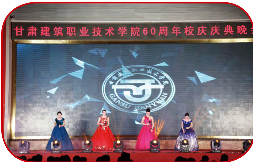
歌曲演唱《共创辉煌》