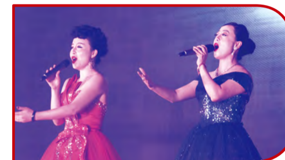
歌曲演唱《共创辉煌》