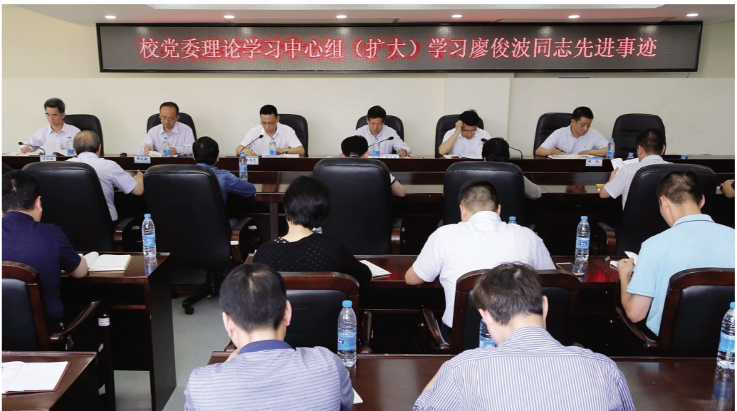
校党委理论学习中心组（扩大）学习廖俊波同志先进事迹

本报讯 5月9日下午，校党委理论学习中心组（扩大）学习会学习“全省优秀共产党员”廖俊波同志先进事迹。校领导，校党委中心组成员，各学院、附属医院党政负责人，机关各部门负责人近60人参加了学习。