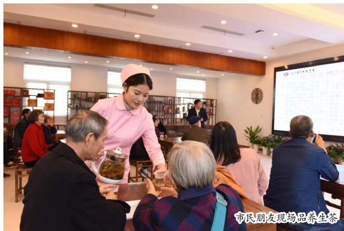
市民朋友现场品鉴养生茶