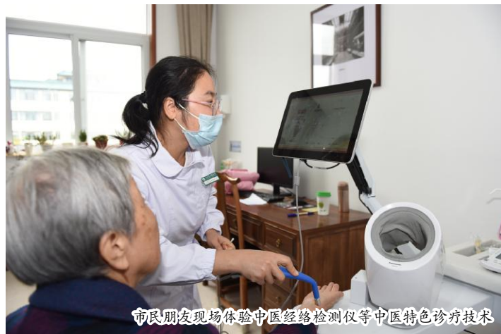
市民朋友现场体验中医经络检测仪等中医特色诊疗技术