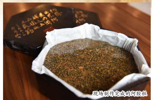
现场制作完成的阿胶糕

很多人都有在冬令时节进补膏方的习惯，但你知道膏方进补需要讲究什么吗？为了让大家冬令进补膏方能达到最好的效用，以下5点注意事项市民朋友一定要牢记心中。