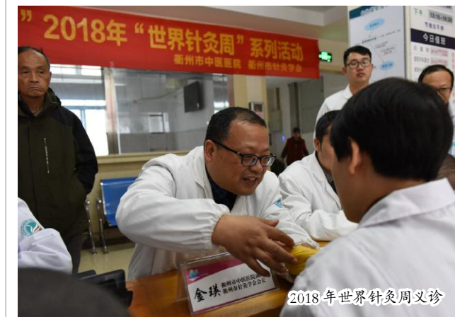
2018 年世界针灸周义诊