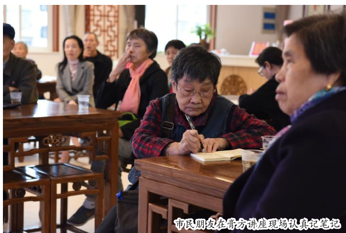
市民朋友在膏方讲座现场认真记笔记