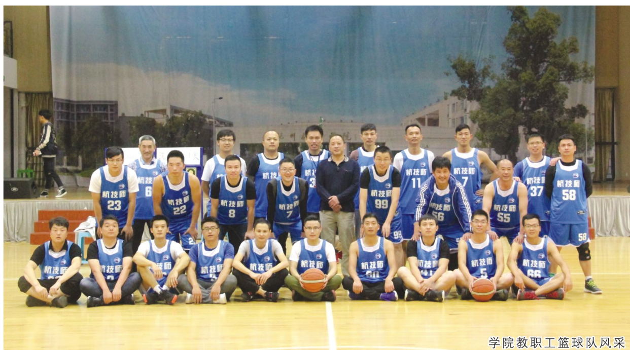
学院教职工篮球队风采

我深信，坚持就是胜利，只要肯付出，一定会有收获！总有一天梦想会照进现实。今后，我会以新时代的工匠楷模为榜样，心怀梦想，在成长的道路上，好好学习，天天向上！