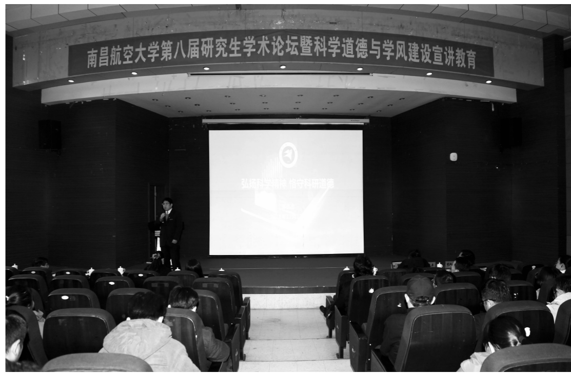
学校举办第八届研究生学术论坛暨科学道德与学风建设教育活动