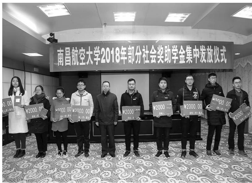
与会领导、嘉宾和校友为受助学生颁奖