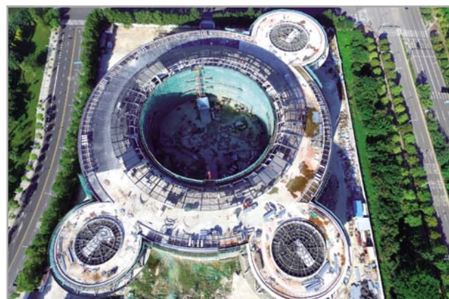
▲近日,深圳分公司东莞光启科学中心项目主体结构和粗装修完工。该项目总建筑面积约5.3万平方米,建成后将为光启新一代隐身技术、海量目标追踪技术等科技产业提供研发空间。

制的该套设备有效解决了该问题,整体系统不建地下浆池,不配压滤设备,无废渣堆放区,节省30%占地面积。减少清淤、排淤环节,回收的砂、石、浆水完全应用于混凝土再生产,真正实现废渣、废水的零排放。该设备在湖北中部、泸州力砣项目相继使用。(刘爽 宣纪舟)