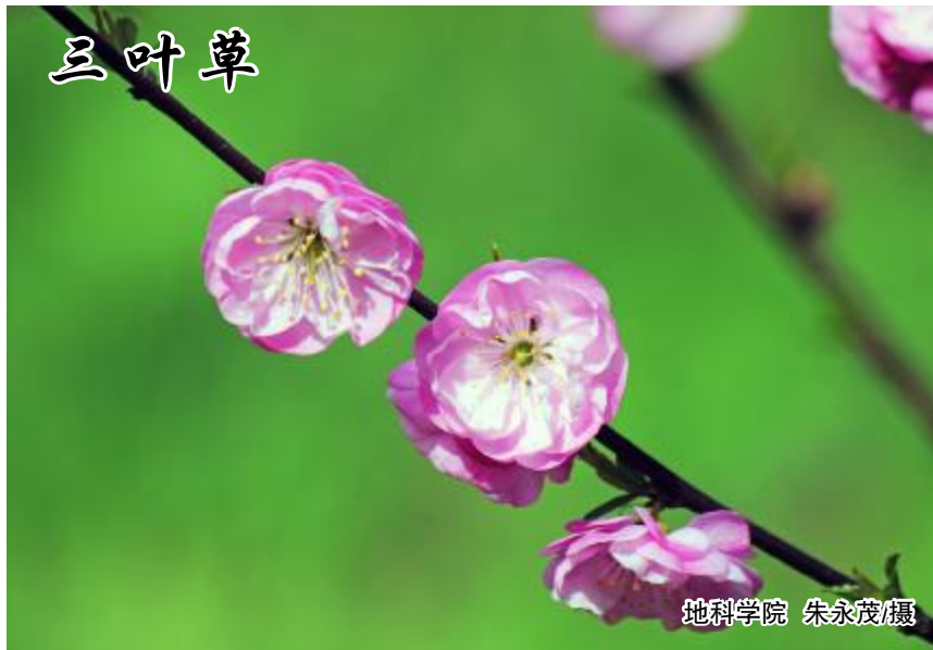
地科学院 朱永茂摄

新时代 新气象 新征程 新作为 我们，从未像今天这样 更加接近希望和梦想 我们，从未像现在这样 懂得依靠奋斗实现梦想 宽阔的大道在脚下延伸 出征的鼓声再次擂响 坚定的信仰激励 时代的呼声召唤 凝聚起建设百年强校的磅礴力量 让我们乘着第三次党代会的东风 不忘初心 牢记使命 戮力同心 砥砺前行 你看，前进的号角已经吹响 科大师生将团结奋进 续写改革发展新篇章 你看，工科主导、特色鲜明 的高水平应用研究型大学的蓝图已经绘就 潮头争渡千帆竞 再创科大新辉煌 让我们以满腔的赤诚 共同祝愿： 我们的科大—— 愿您春蚕华发 编织青春梦想 愿您校园如歌 唱响最美华章