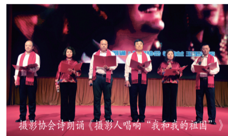
摄影协会诗朗诵《摄影人唱响“我和我的祖国”》