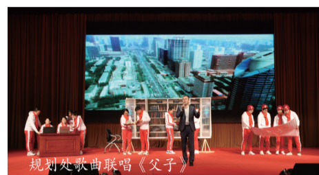
规划处歌曲联唱《父子》