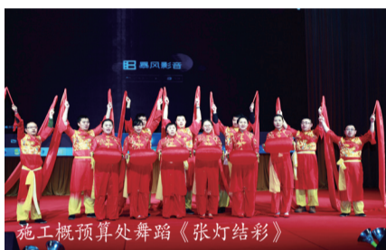
施工概预算处舞蹈《张灯结彩》