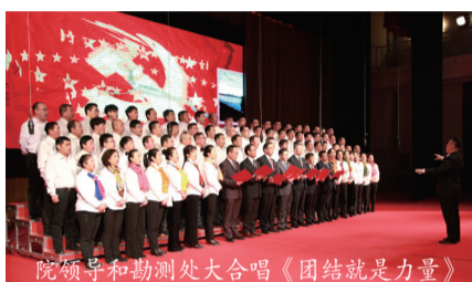
院领导和勘测处大合唱《团结就是力量》

全院干部职工参与活动积极踊跃，职工精神振奋、士气倍增，通过这台体现水利行业特点、极具院特色，娱乐形式多样化的节日联欢，为院加强文明、文化建设奠定了坚实基础。