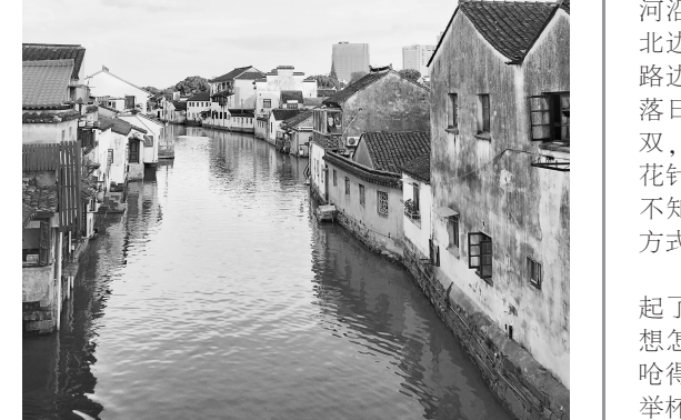
江南水乡