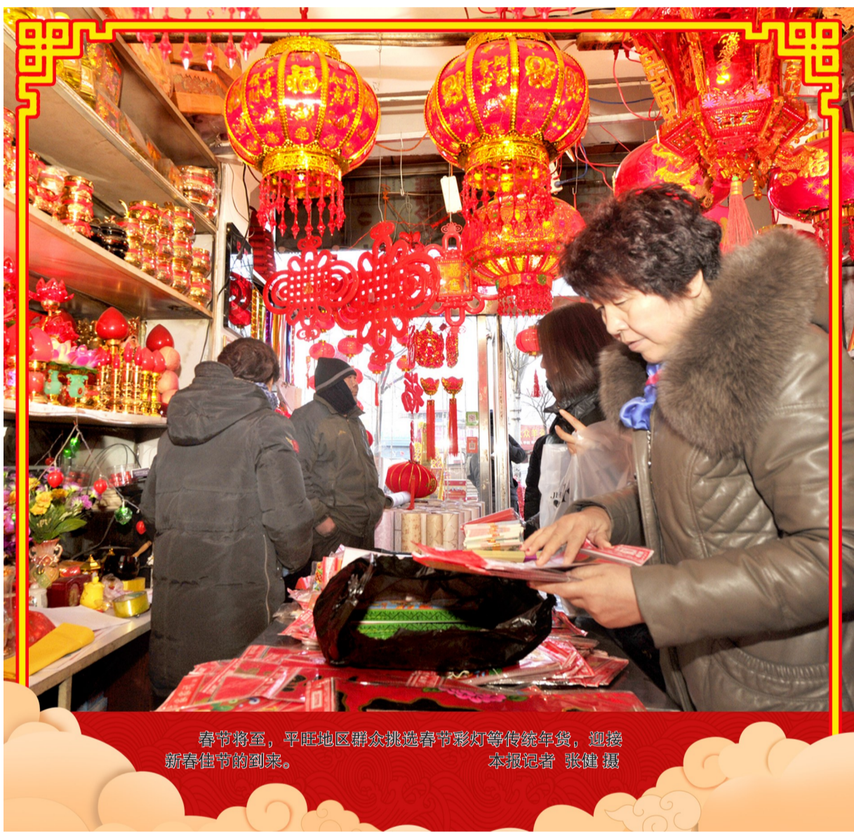
春节将至，平旺地区群众挑选春节彩灯等传统年货，迎接新春佳节的到来。