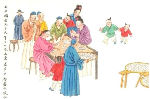
在中国北方，年夜饭是家家户户的必修课。

抚今追昔，吃年夜饭，品“八大件”，倍感幸福生活来之不易，发自内心的感恩我们日新月异欣欣向荣的国家；感恩与我们一同成长、百折不挠的企业；感恩含辛茹苦精心培育我们的父母。只要心中充满爱，我们的生活就更美好，我们的明天就更美好！