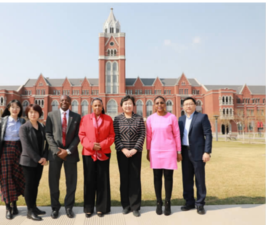
南非驻华大使馆公使一行来校参观访问

南非驻华使馆公使一行在海河园校区参观了我校旅游管理学院相关实训设施，观摩学生实践教学情况，品尝了学生烹饪实践作品。对我校的办学、专业实力和教育教学实践成果印象深刻，表示极大赞许和认可，并希望我校可以在对南非的教育交流中能够开展更多的项目，成为中南教育合作中的闪亮一环。(办公室)