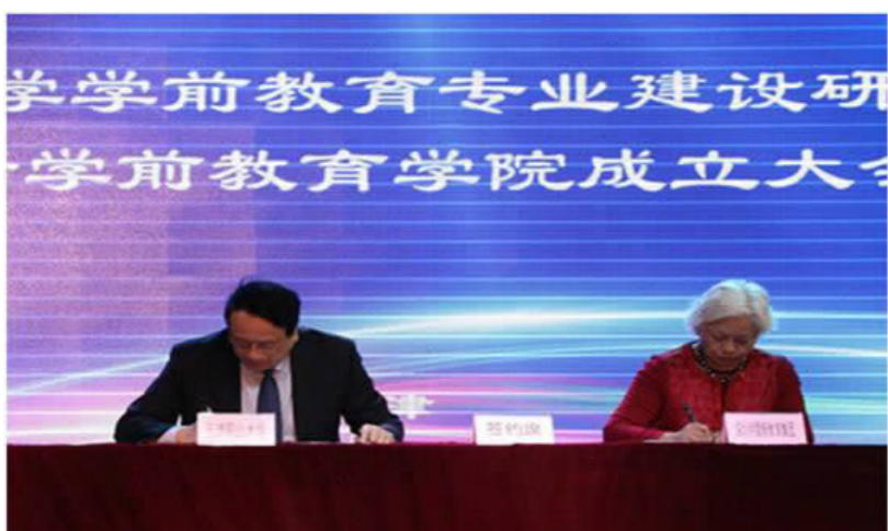
我校举办学前教育专业研讨会暨特蕾新学前教育学院成立仪式

沈书记在致辞中首先感谢了深圳特蕾新教育集团为学前教育和职业教育做出的贡献，分析了职业教育改革下学前教育专业的政策优势和发展要求，介绍了学校在推进特蕾新学前教育