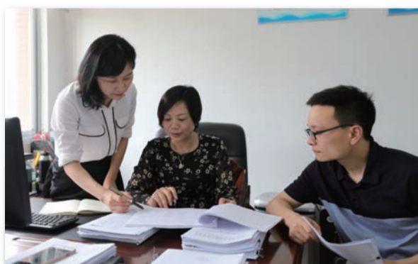
巡视整改工作监督检查组督查巡视工作进展。