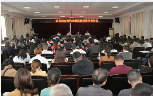
附一院召开医药供应商代表廉洁协议集体签订会。