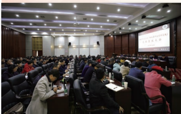
我校（院）召开巡视整改大会。