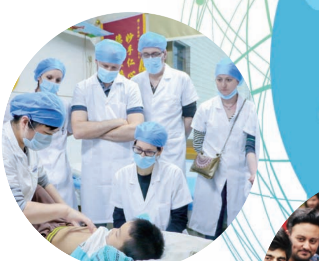
法国中医学院校来校访学