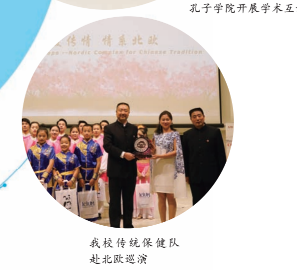
我校传统保健队赴北欧巡演