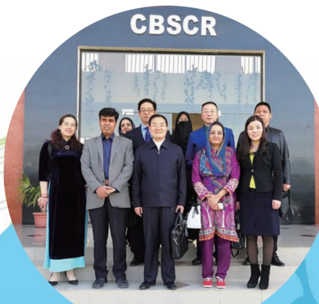
中-巴中医药民族医药研究国际合作基地揭牌