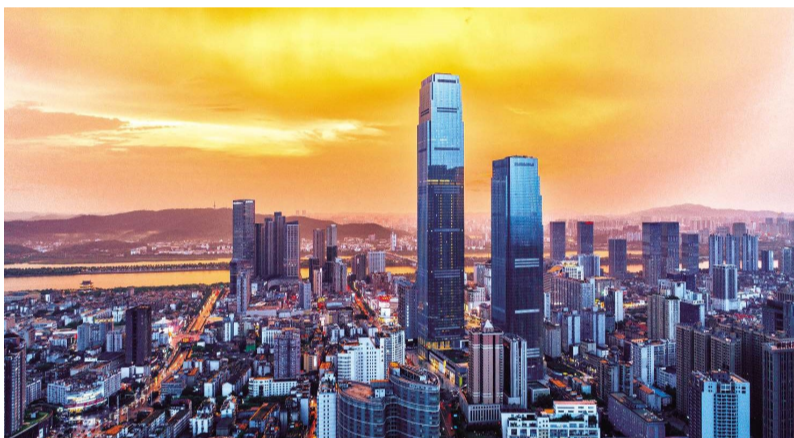
西南分公司 谈里宾/摄 《湘》 遇黄昏下——长沙国金中心

十年磨一剑,这位年轻的核级焊工,用自己的逐梦历程诠释了专注执着、精益求精、勤奋钻研、艰苦奋斗的“焊工精神”,走出了一条当代青年技能工人光辉的职业发展之路。