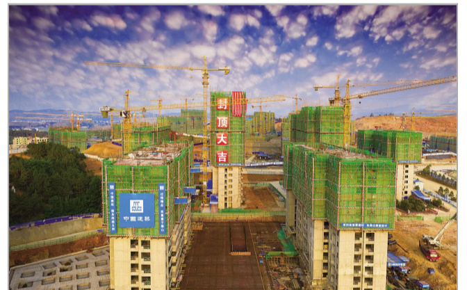
▲近日，西南分公司云南鲁甸卯家湾易地扶贫搬迁安置区建设项目首栋主体楼栋封顶。该项目建设总投资33.65亿元，是云南省重点打造的跨县区易地扶贫搬迁安置区项目。