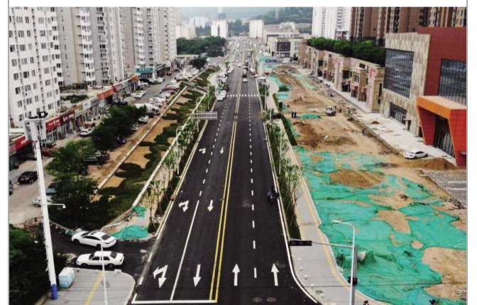
▲近日，三公司青岛敦化路东段道路拓宽工程上面层摊铺完成，配套设施同步完工，实现全线通车。项目所在路段为青岛市市北区重点工程。