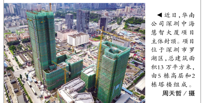
▲近日，华南公司深圳中海智慧大厦项目主体封顶。项目位于深圳市罗湖区，总建筑面积13万平方米，由5栋高层和2栋塔楼组成。