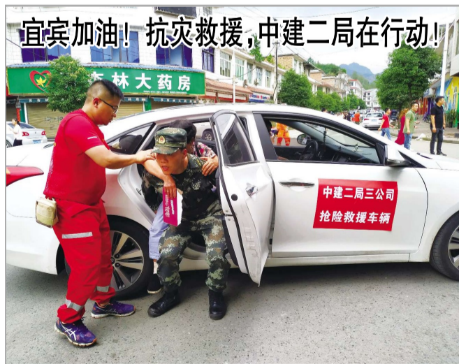
宜宾加油！抗灾救援，中建二局在行动！

成立后于境外设立的主要从事泛地产类业务的上市投融资平台，先后在海外投资了多个住宅、商业、物流及工业地产类项目。柬埔寨项目紧随国家“一带一路”倡议，致力于打造成为柬埔寨具有影响力的经济特区。（毛林超 高泽军）