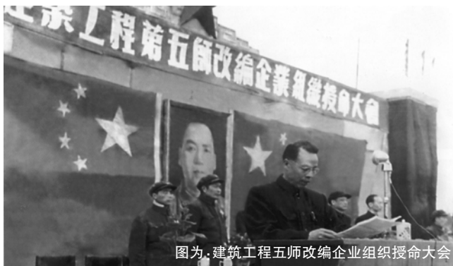
图为,建筑工程五师改编企业组织授命大会

一枪一血,他们拼来了新中国的成立,一砖一瓦,他们见证了新中国的成长。他们是由华东野战军步兵99师改编的建筑工程五师(中建二局前身),也是新中国的第一批建设者。