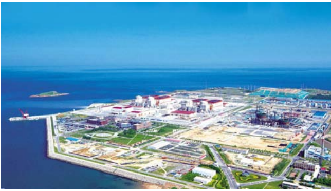
《渤海明珠——建设中的大连红沿河核电站》

皑皑白山分二漠,空流雪乳育草花。 左公筹边志千载,元抚修渠润万家。 石油辉煌惊世界,白棉璀璨冠中夏。 天山南北同歌舞,相亲相爱是一家。