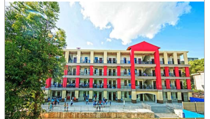
▲近日,西南分公司湖南永州零陵区学位建设EPC项目的柳子中学、荷叶塘学校和幼师高专附小交付。项目是永州市一号民生工程。