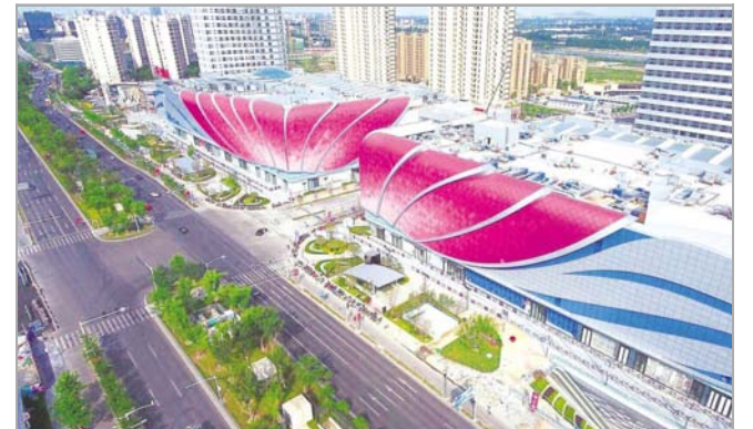
▲近日,上海分公司青浦万达茂项目开业。项目位于上海市青浦区,总建筑面积近45万平方米,商业建筑面积约24.7万平方米,是上海的首个文化旅游商业综合体。

据悉,三个项目累计装机容量2.1兆瓦,预计年发电量200万千瓦时(度),将有效优化项目当地周边用电结构,进一步提升清洁能源的使用比例。(于轲伟)