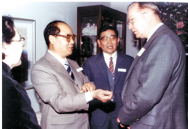
1986 年应诗达教授访问美国