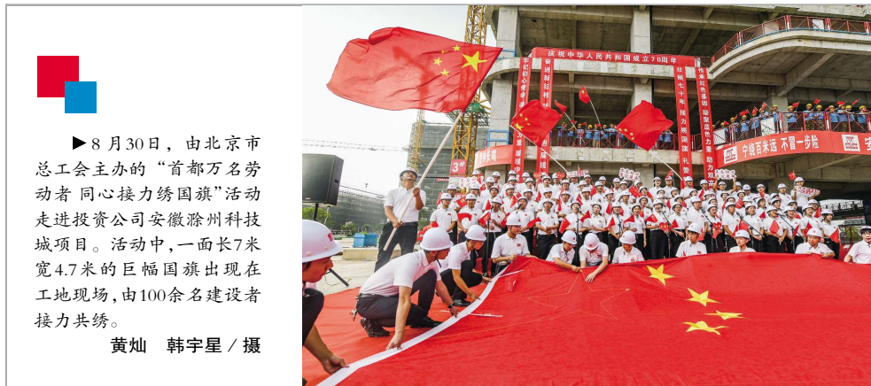
▶8月30日,由北京市总工会主办的“首都万名劳动者同心接力绣国旗”活动走进投资公司安徽滁州科技城项目。活动中,一面长7米宽4.7米的巨幅国旗出现在工地现场,由100余名建设者接力共绣。