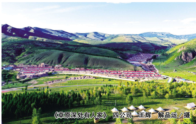
《草原深处有人家》

秋日故土的念想是清馨的,乡野中麦田的稻秆被打谷机碾过而发酵的气息,用尽鼻息嗅探一口,再深深地吐纳一口,似乎浑身充满了精气神。