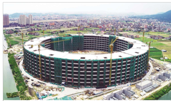
▲8月26日，华南公司福建莆田创世纪超算数据中心项目封顶。项目总建筑面积约19.7万平方米。呈圆环形，7层厂房建筑。项目建成后将为当地提供免费的算力服务接口。