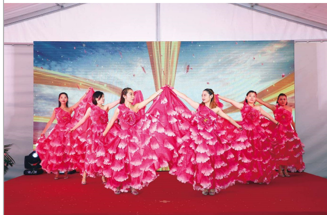
▶8月26日,北京中建地产公司联合廊坊日报社共同主办了“我和我的祖国”主题活动,大家用歌声、舞蹈、朗诵等形式表达了对祖国华诞的祝福。