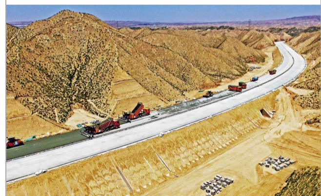
▲近日，西南公司甘肃兰州白银高速项目G6保通路段贯通。该项目是甘肃省省列重大项目，标段主线全长3.1千米，整条线路开通后将白银至中川机场的行车时间缩短至40分钟。