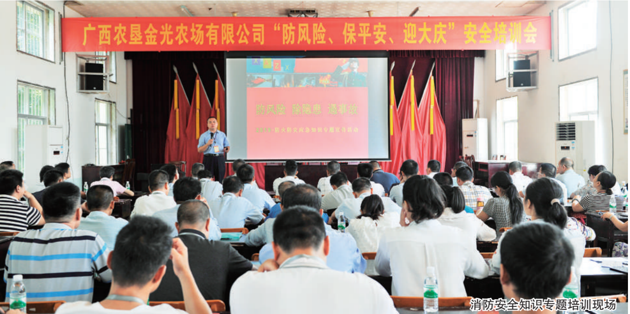
消防安全知识专题培训现场

为进一步加强公司安全教育培训,提高安全生产管理水平,9月3日,金光农场公司组织全体管理人员开展“防风险、保平安、迎大庆”安全知识专题培训。 本次安全知识专题培训特别邀请广西新安防火宣传咨询服务中心消防教员进行现场授课,培训内容涉及自然灾害预防、地质灾害避险、安全注意事项、灭火知识技巧等,并结合大量事故案例开展分析讲解,现场进行安全操作及消防器材使用演示,并组织开展消防演练,使公司全体管理人员认识到安全生产的重要性,大大增强自救自护能力。 下一步,该公司将紧密围绕“防风险、保平安、迎大庆”主题,多渠道、多角度开展系列安全培训活动,不断树立安全意识,进一步提升安全生产管理水平,努力为公司高质量发展创造更加安全稳定的环境。