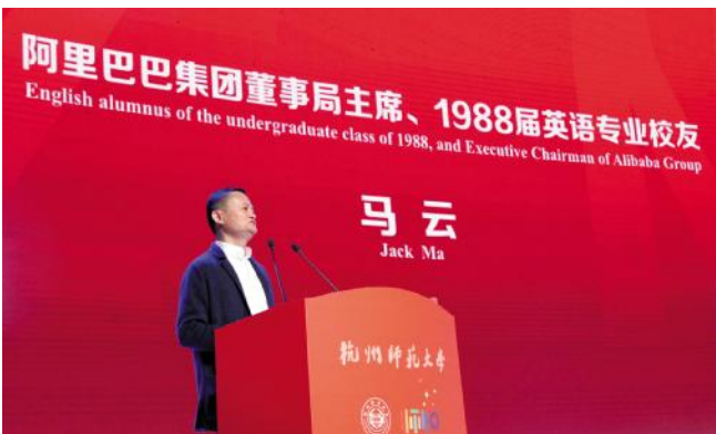
2018年5月13日,马云在杭师大110周年校庆大会上讲话