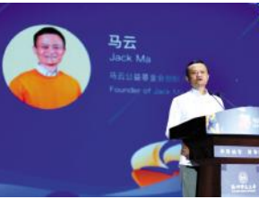
2019年7月15日,2019马云乡村人才计划在杭师大启航