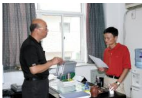
2006年7月23日,马云与杭师大童富勇教授商讨实施中国新农村教师专业发展计划

在杭师大人眼里,对母校的邀请,马云从来都是痛快响应的。2008年5月18日,学校百年校庆,马云从大洋彼岸赶回国内,一下飞机就冒着大雨赶回母校,与全校师生共襄百年盛典;同年10月,我