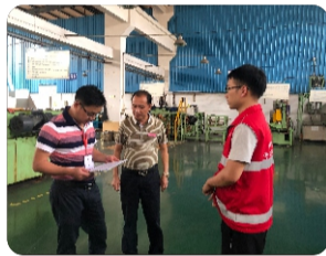
镇、村相关部门领导和工作人员亲临现场指导演练