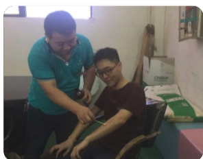
为“伤员”降温之后，并迅速涂烫伤膏。