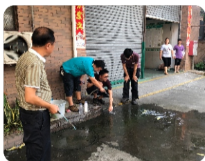
迅速用自来水冲洗伤口进行降温处理