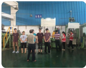
参加演练人员紧急集合