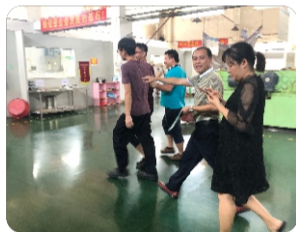
救援人员迅速将“伤员”带离现场处理。