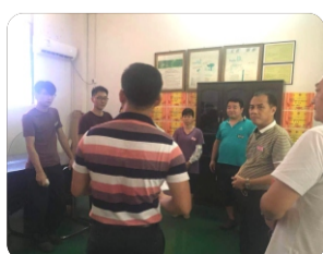
草墩村领导在最后作重要讲话