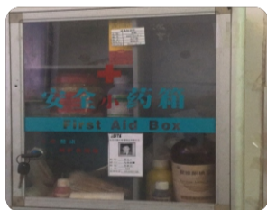
配置在生产部办公室的小药箱