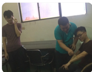
“受伤员工”只烫伤手臂表皮，属轻微伤害，由于处理及时，不算严重。为预防伤口感染，救援人员立即拨打120将“伤员”送附近医院进一步处理。