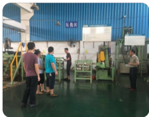
演练开始，假定一名工人在作业中不小心被刚出炉的锡柱烫伤左手臂，情况危急。