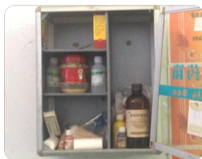
小药箱里烫伤膏、酒精、绷带、棉签等药品一应俱全