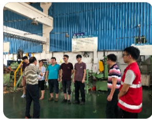
总指挥介绍本次演练目的与步骤