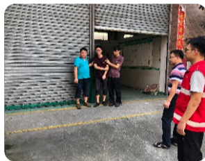
救援人员将“伤员”带到车间门口的水龙头处进行降温处理。