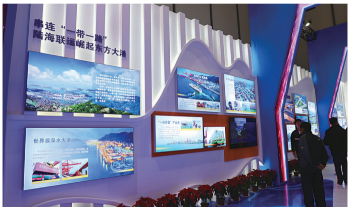
图7:专篇介绍陆海联运东方大港