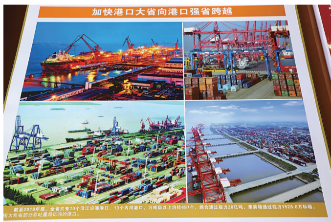
图4:助力港口强省建设