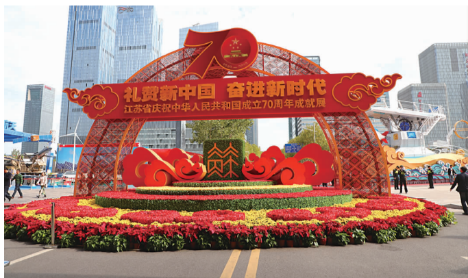
图1:展览入口标志造型