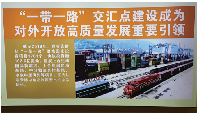
图3:中哈物流基地、中欧班列引领对外开放

“能取得这样的发展成就真不简单,我们应该感到自豪,为祖国点赞、打call!”来自港口参观团队中的一位老员工动情感慨道。笔者也发现,在这次省级大型成就展上,不少港口元素悉数亮相其中。