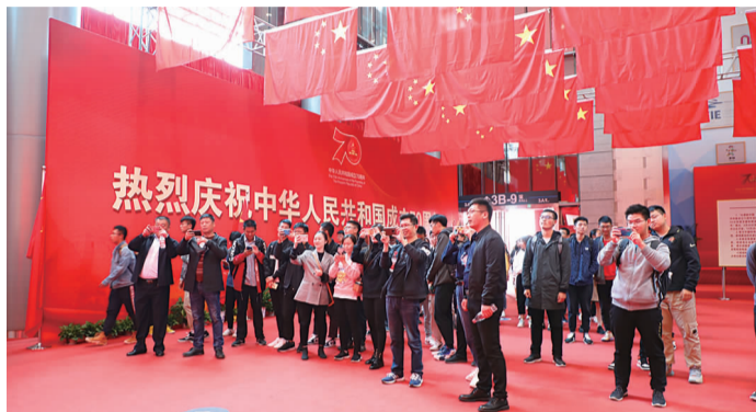
图2:记录江苏精彩瞬间

“能取得这样的发展成就真不简单,我们应该感到自豪,为祖国点赞、打call!”来自港口参观团队中的一位老员工动情感慨道。笔者也发现,在这次省级大型成就展上,不少港口元素悉数亮相其中。