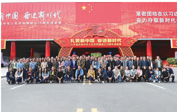
图10:港口百人参观团队

据了解,江苏成就展自9月30日起开始对公众开放,到10月28日为止。为进一步激发职工的成就感、自豪感,集团党委精心安排了此次参观活动,它也作为港口控股集团“不忘初心、牢记使命”主题教育活动的重要内容之一。