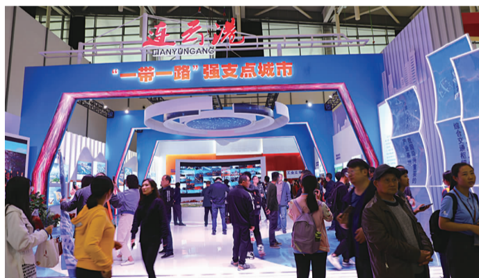
图9:连云港城市展台

据了解,江苏成就展自9月30日起开始对公众开放,到10月28日为止。为进一步激发职工的成就感、自豪感,集团党委精心安排了此次参观活动,它也作为港口控股集团“不忘初心、牢记使命”主题教育活动的重要内容之一。