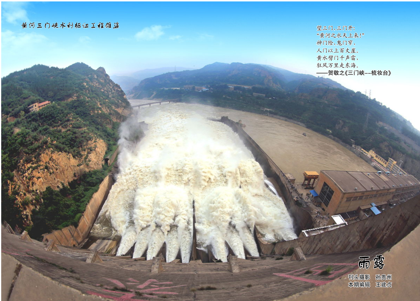
黄河三门峡水利枢纽工程雄姿

望三门，三门开： “黄河之水天上来！” 神门险，鬼门窄， 人门以上百丈崖。 黄水劈门千声雷， 狂风万里走东海。 ——贺敬之《三门峡——梳妆台》