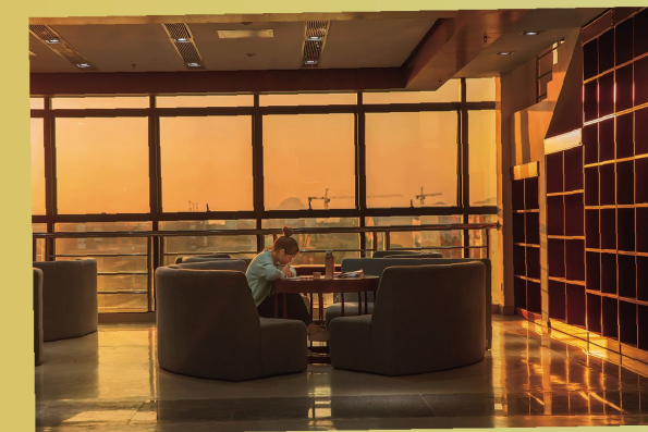
《书中自有黄金屋》