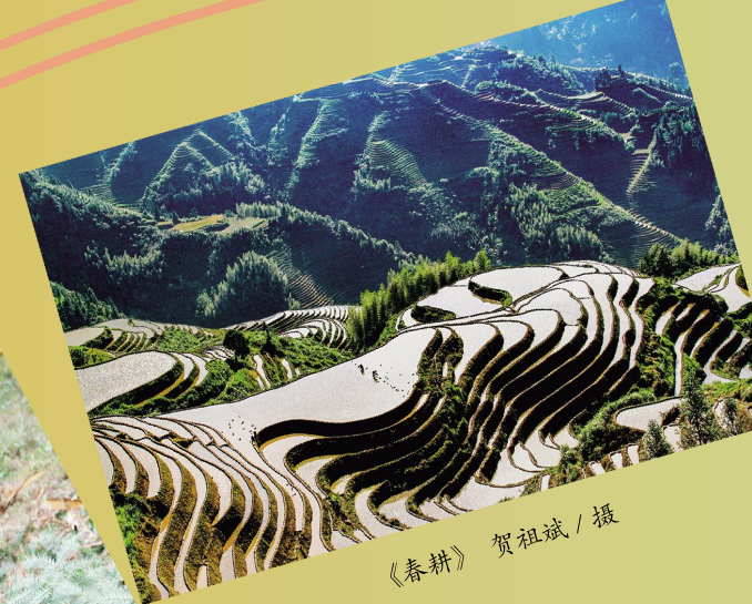
《春耕》贺祖斌 / 摄