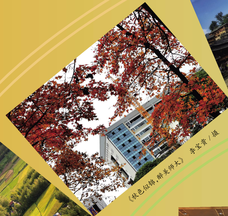
《秋色似醉，醉美师大》