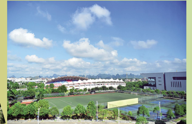
《天高海阔》