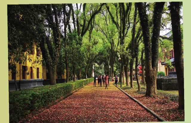
《魅力王城》