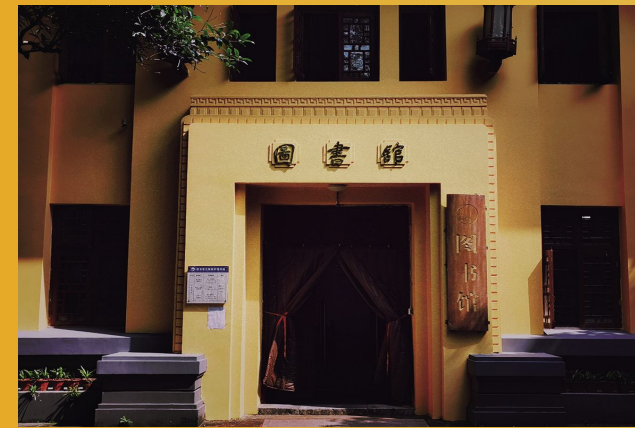
《求知门》袁贤明 / 摄