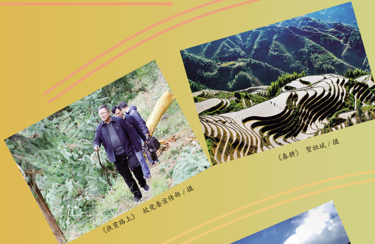
《扶贫路上》