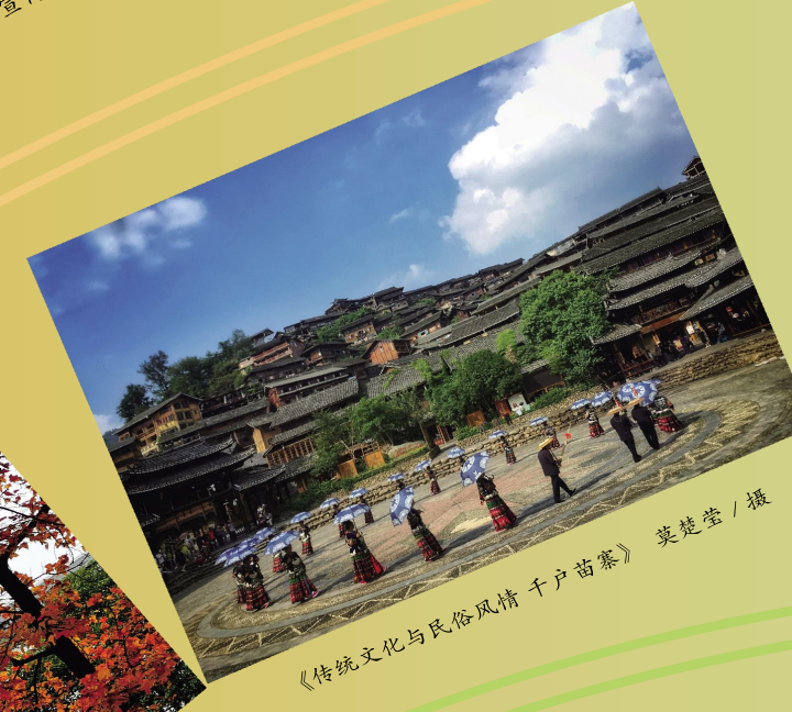
《传统文化与民俗风情 千户苗寨》