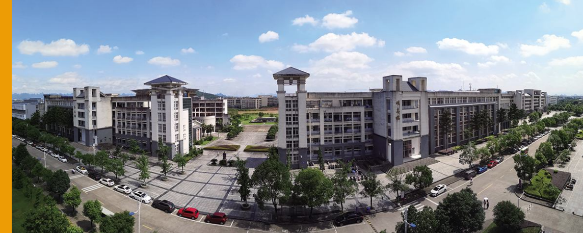
《美丽的雁山校园》