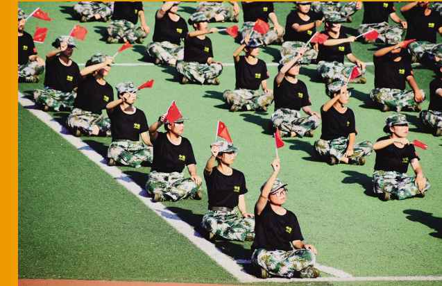
《军训之光》