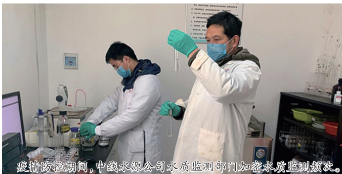
疫情防控期间,中线水源公司水质监测部门加密水质监测频次。

“早上好,继续认真做好疫情防控工作,及时掌握各方信息。”“各部门尽早筹划二月份工作计划,并提交分管领导审核。择机通过群方式召开总经理办公会。”“做好日常巡查、安全监测,确保工程安全;水质监测要加密监测频率,确保供水安全……”公司在服从、维护大局的同时,也在周密部署公司各项重点工作,为保障经济社会大局稳定守住阵地。