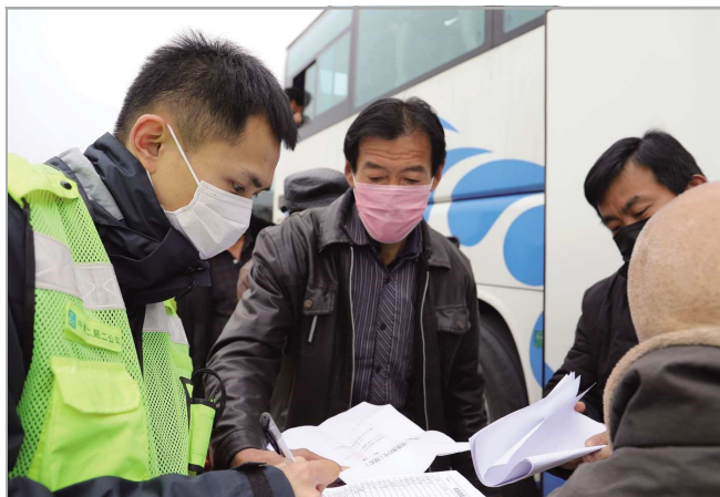
2月27日起,二公司青岛维多利亚湾项目开展“点对点”包车接工友返程行动。4辆大巴,15个小时,累计行驶1127公里,项目当日顺利从山东省聊城市接运107名工友。

疫潮尚未退去,防控亟待功成。在党中央、上级党组织和局党政的坚强领导下,二局人将继续保持清醒、顽强奋战,坚决打赢这场疫情防控的人民战争、总体战、阻击战。正如秋山、发如风雨,我们的信心始终坚定:走过这段征途,必会迎来华枝春满、万象更新。