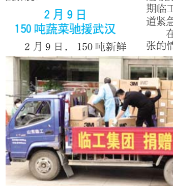
临工集团捐赠防疫物资

当前市场竞争愈加激烈，企业要持续发展拼的是综合竞争力。要极限施压，不仅对经销商施压，还要对公司方方面面都要施加压力，层层分解目标任务，增强各模块竞争力。 文总要求，要创新工作方式，丰富激励措施，加大督查力度，全面提升执行力。设立公司级项目管理办公室，统一归口管理公司级项目，完善相关制度，严抓项目进度管控、绩效评价和考核激励，推动公司级项目有序高效开展。要通过约谈、绩效评价、绩效考核等方式实施精准激励，全面开展工作督查，以制度性措施推动全员执行力提升。 文总还对近期各模块重点工作任务作了安排部署。 (战略规划本部 王安徽)