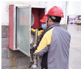
本报讯 3月份以来，市场逐渐回暖，生产进入旺季，为践行“三现主义”，服务生产一线，更好地为生