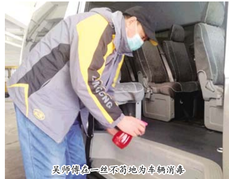
吴师傅在为一丝不苟地为车辆消毒