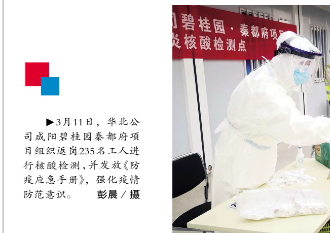
3月11日,华北公司咸阳碧桂园秦都府项目组织返岗235名工人进行核酸检测,并发放《防疫应急手册》,强化疫情防控防范意识。