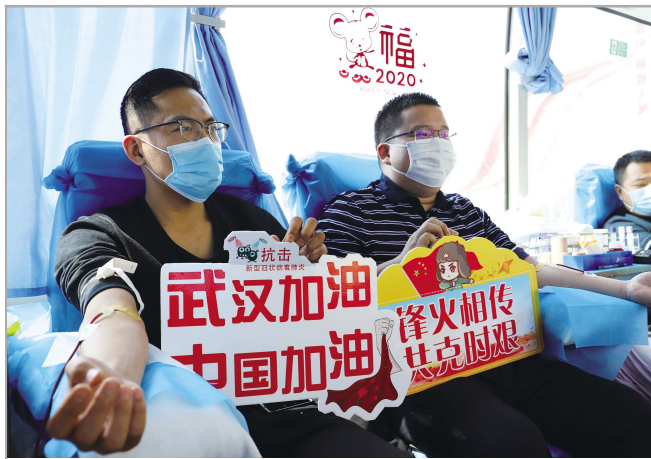
3月10日,二公司青岛维多利亚湾项目开展志愿献血活动。党员干部、团员青年及工友等56人累计献血19600毫升,缓解了当地血库压力。

见证过楚河汉街从进场到繁华,见证过汉秀剧场“大红灯笼”高高挂,见证过精武路超高层地标直上云霄……这些“新武汉人”的身上早已烙上了江城的印记。以一份责任,守一座城池。春暖花开,铁军传奇还在续写!