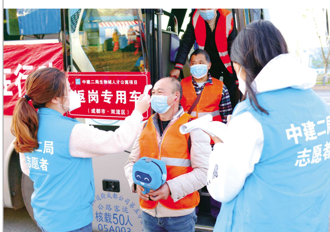
3月16日,西南公司“春风行动”复工专车接送项目工人返岗,首辆专车护送21名体检合格的工人直达成都国际生物城人才公寓项目。