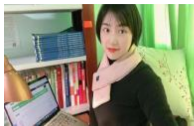
不能开展的教学,只要学生有需要,她必定有回应。童老师说:“我的家人都在战‘疫’前线,我也要尽可能地出一份力量,但愿疫情早消,国泰民安。”

出门。大致掌握学生情况后,她开始构思“在线学、在家学”的工作计划,并针对性地为不同年级段学生规划出了合理的寒假学业任务。为了给同学们呈现最好的教学课件,童老师花费大量时间维护国家级精品课程《财政学》,并在完成之后及时在朋友圈开放分享了课程资源。完成了网课更新,童老师又开始摸索雨课堂、学习通、慕课堂等在线开放平台和直播,并搭建起了课程的SPOC专区。在她的概念里,没有