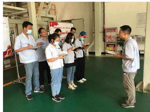
涂装党支部党员正在学习习近平总书记《在纪念中国人民抗日战争暨世界反法西斯战争胜利75周年座谈会上的讲话》