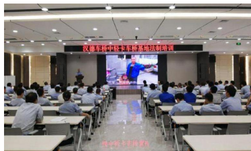
保卫部召开法制培训会

保卫部以党建为引领，坚持预防为主、防“治”结合的综合治理原则，人防、物防、技防相结合建立严密治安防控体系，提高企业治安防控水平。