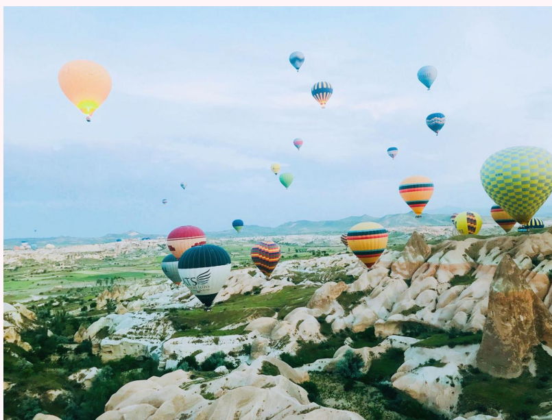
天空中的浪漫 陕汽商用车

谈起对文字的好感,我不知从何说起,也许与自己的名字有关,因为多了个“文”字吧,如果真的去寻找准确的答案,我想应该是在那个青涩的叛逆期。