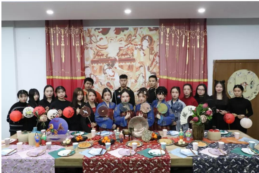
散黛随眉广，胭脂逐脸生