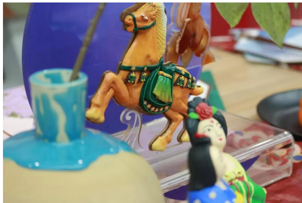
骏马踏铜蹄，骤然响金铃