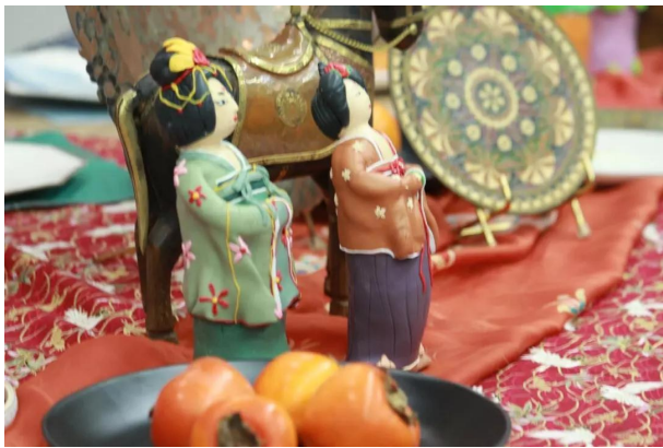
泥人无语不抬头，羞摩羞，羞摩羞