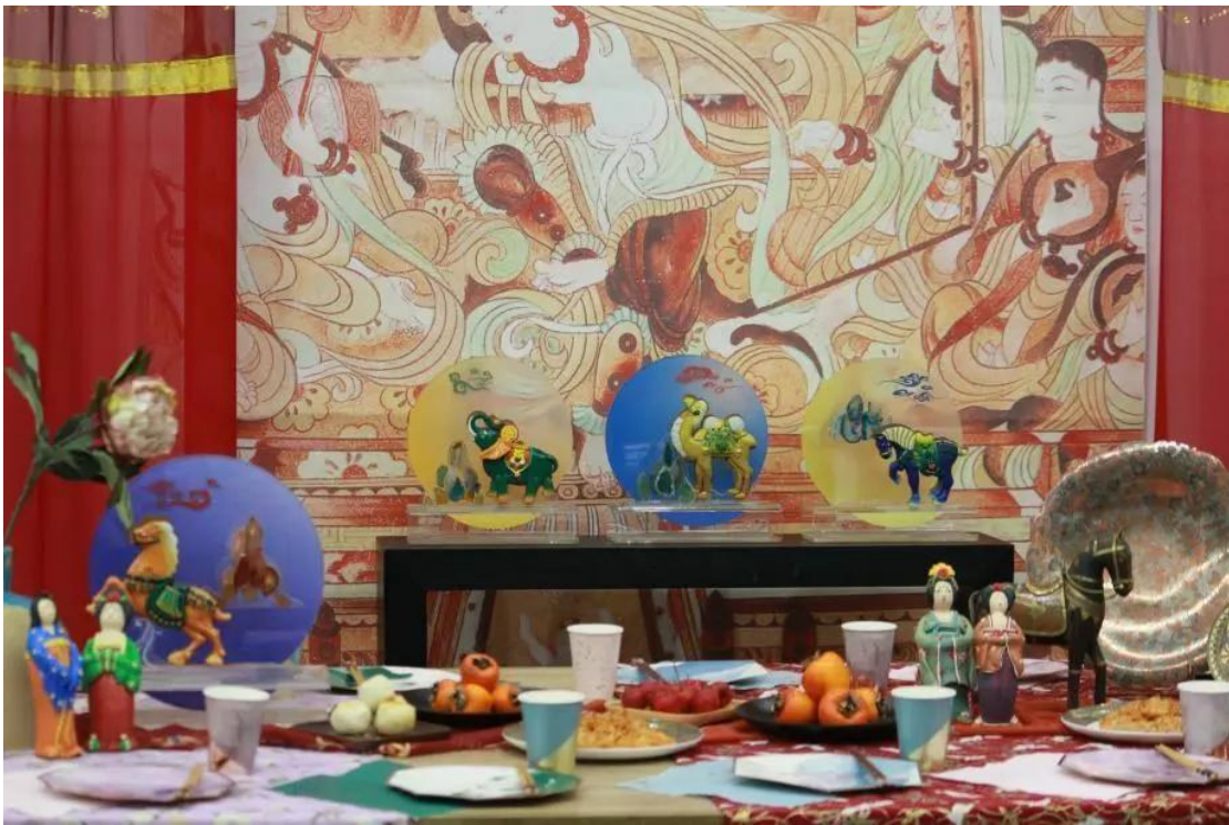
金樽清酒，玉盘珍馐，色香诱