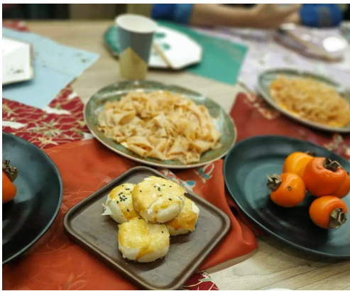
纤手搓来玉色匀，碧油煎出嫩黄深