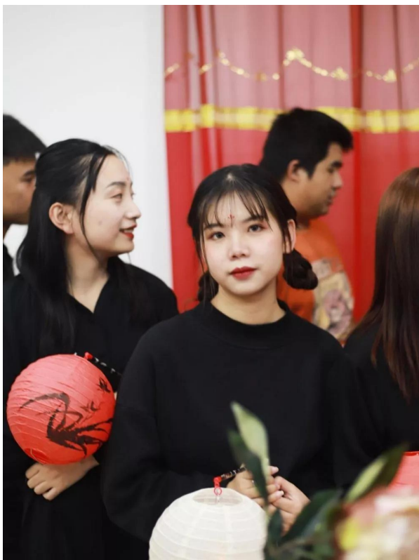
见客入来，袜划金钗溜，和羞走

谱续唐风，歌延宋韵，绛帐繁香拂。穿越到大唐参加一场派对？听起来是不是很玄妙！更玄妙的是，这场派对其实也是文创学院环艺专业的核心课程《软装设计》的实践单元。在课堂上穿唐服、化唐妆，盛世霓裳，唐风华韵，以此来体验大唐盛世的荣耀和繁华。老师先带领学生一起解读了这部剧里面体现出来的唐朝美学，领会其中的韵味。然后提取其中的唐朝元素，在近十天的策划和准备后，成功举办了这场派对。