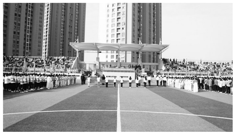
第十五届田径运动会开幕式现场。

十月是拼搏之月,是奋斗之月,更是我们安徽工商职业学院一年一度的校运动会开展之时,各学院的运动健儿们怀着激动的心情来参加本次校运会。我们的学生干部们,当然也欣然领受了组委会的重任,就让他们带领我们走进本次运动会吧!