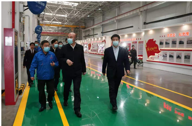
观摩团参观陕汽商用车总装车间

11月13日,陕西省2020年重点项目观摩团走进陕汽商用车。由中共陕西省委组织的全省2020年重点项目观摩活动于11月3日启动,连日来,观摩团深入全省各市(区)实地观摩产业高质量发展项目,旨在深入学习贯彻党的十九届五中全会精神,认真落实习近平总书记来陕考察重要讲话,落地落实全省当前重点工作和“十四五”规划编制工作会议部署,聚焦新时代陕西追赶超越目标任务,推动重点项目加快