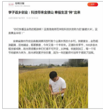
光明日报客户端报道我校学子创业故事。