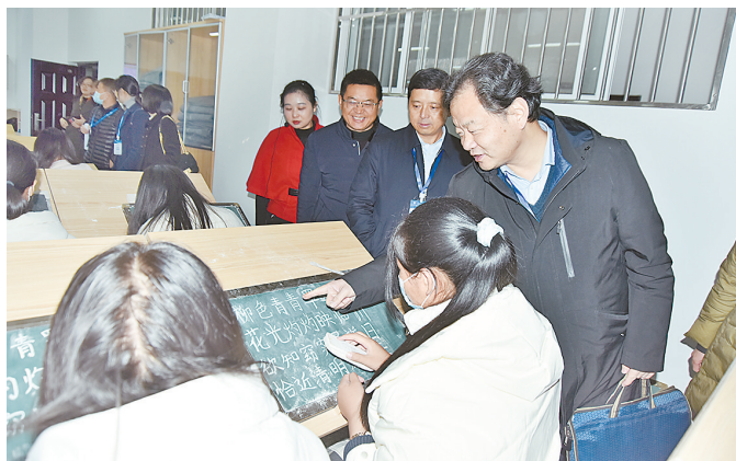
专家组一行考查儿童教育实验实训中心。

本报讯 12月2日至5日,教育部普通高等师范类专业二级认证专家组到我校,对汉语言文学专业进行现场考查认证。专家组对汉语言文学专业的总体评价是:师范人才培养富有成效,认证评建工作扎实有效,“主线”“底线”两线建设初见成效。