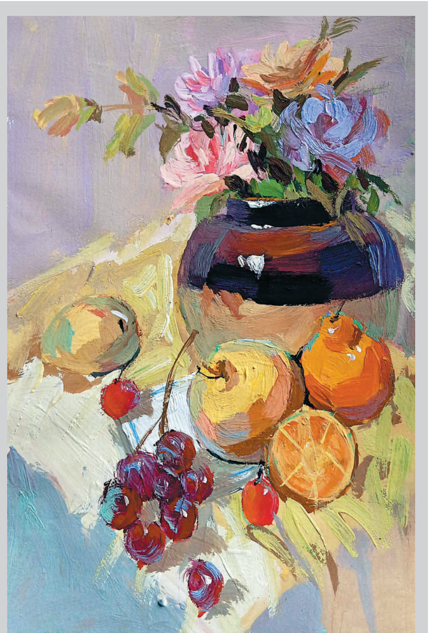
水粉作品 装饰3192班 熊钰鑫