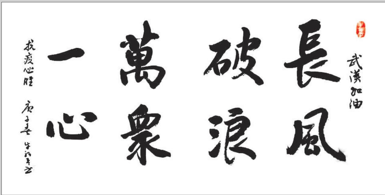
书法作品 就业指导中心 牛新平