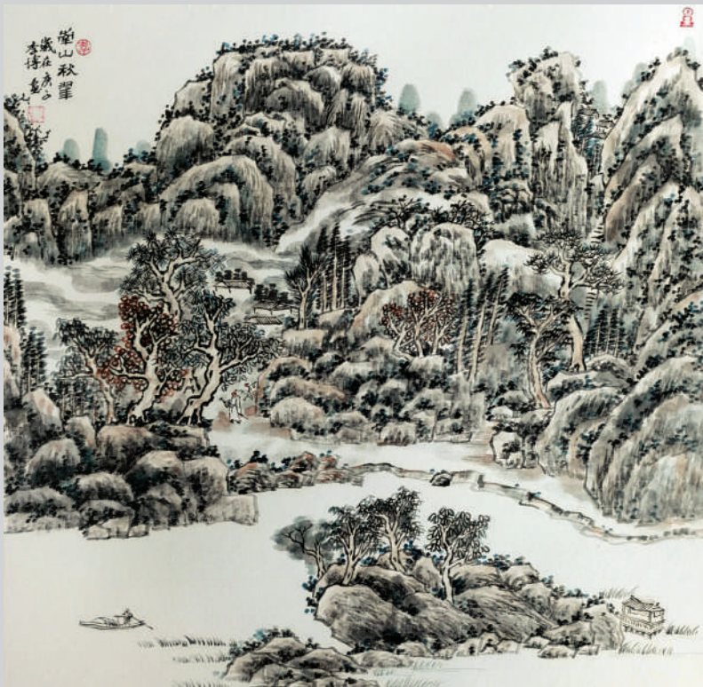
国画《南山秋翠》 党委(校长)办公室 李博

在平凡的岗位上,发挥自己的专长,以实际行动发挥一名党员的先锋模范作用。他就是陕西铁路工程职业技术学院铁工5013班毕业生、厦门轨道交通集团建设分公司机电设备部项目经理张涛。目前2号线轨道工程项目管理工作正是由他负责的。轨道交通是现代城市的交通大动脉,厦门地铁就正在如火如荼地建设中,地铁2号线今年第四季度就要开通了,厦门即将进入换乘时代。