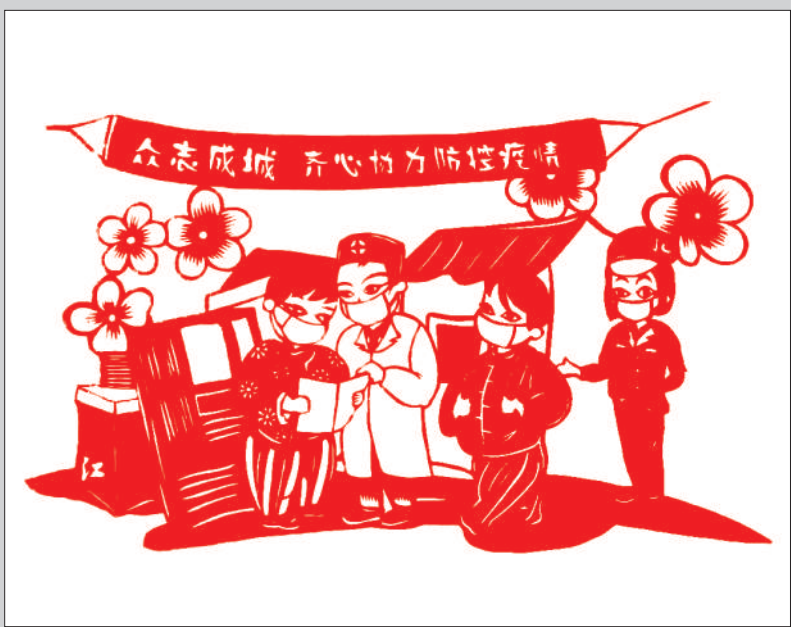
剪纸作品 盾构3196班 闫俐君