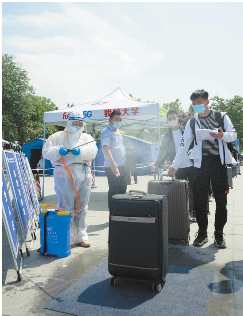
对行李物品进行消毒

本报讯(记者 王莹)5月15日,学校大二大三学生分期分批、错峰错时有序返校。“超长版寒假”终于结束,临渭、高新两校区校门口,学生们自觉间隔一米排队,接受入校体温检测,秩序井然。沉寂已久的校园终于迎来了蓬勃朝气。