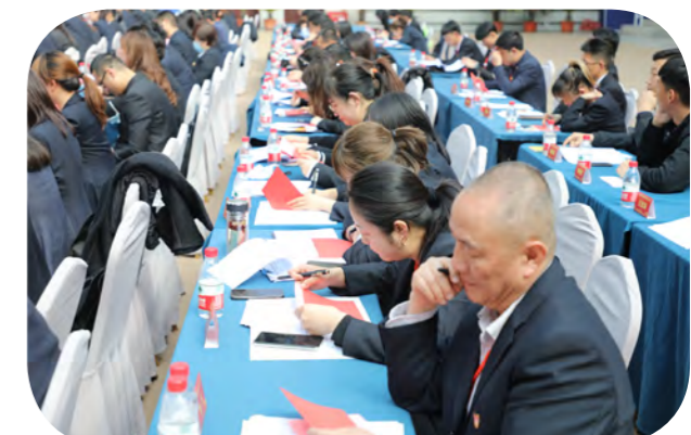
与会人员认真填写选票