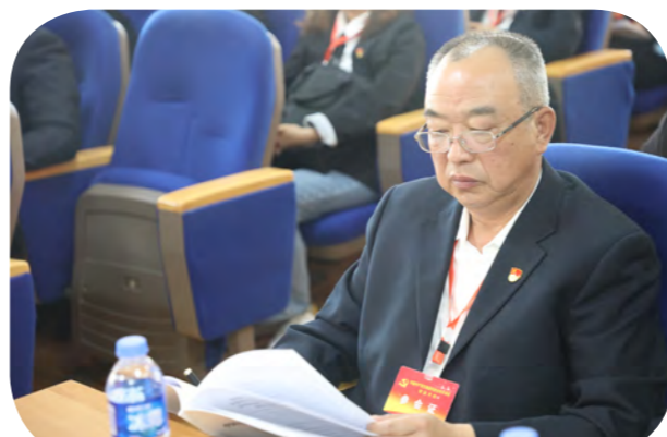
退休领导认真聆听报告