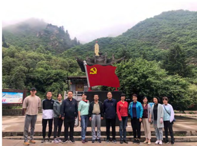
肃党组织的建设、发展和马克思主义在甘肃的传播，做出了极其重要的贡献。