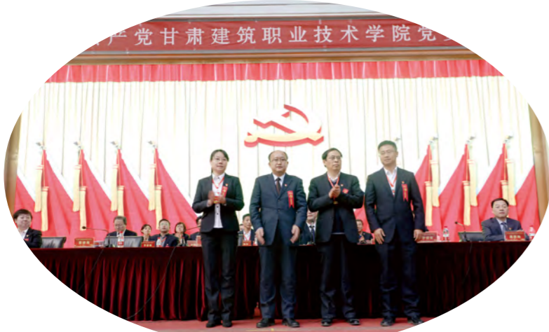
新选举出的纪委委员