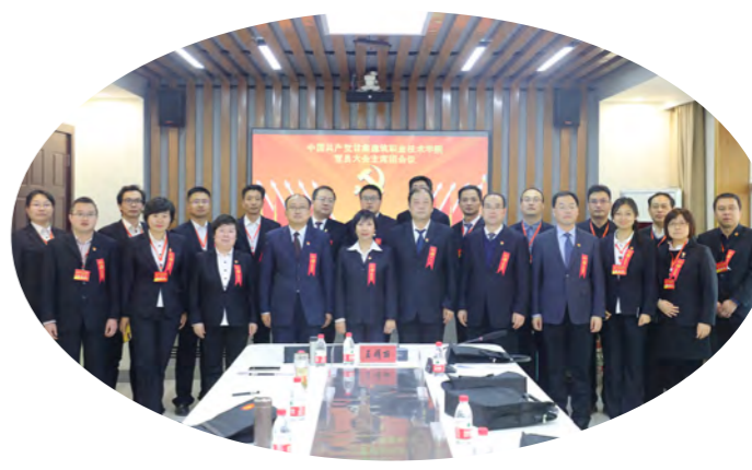
大会主席团成员合影