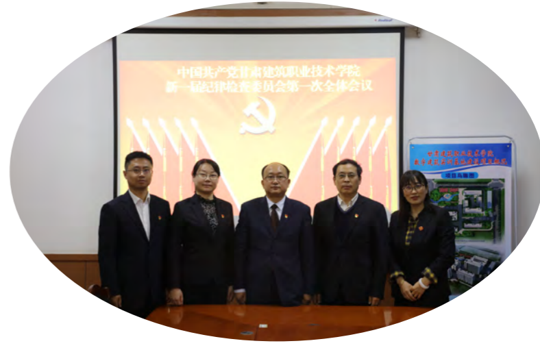
新一届纪委委员召开第一次全体会议