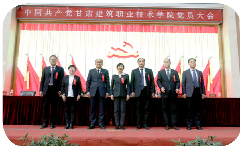
新选举出的党委委员