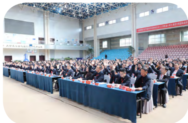
与会人员选举通过决议