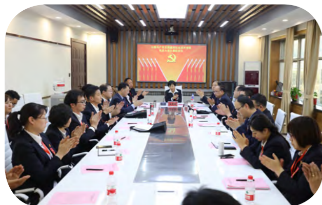
大会主席团召开第二次会议