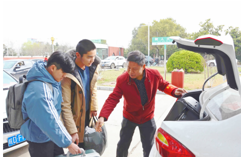
教师帮助学生入校