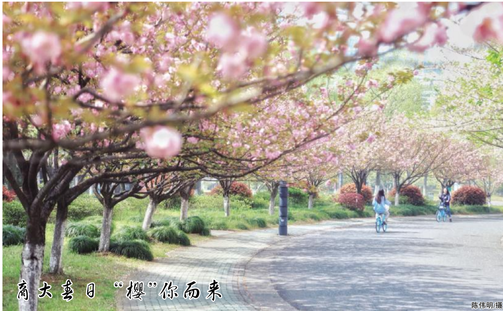
浙大春日“樱”你而来