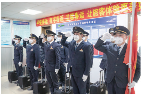
上图为党员突击队庄严宣誓。