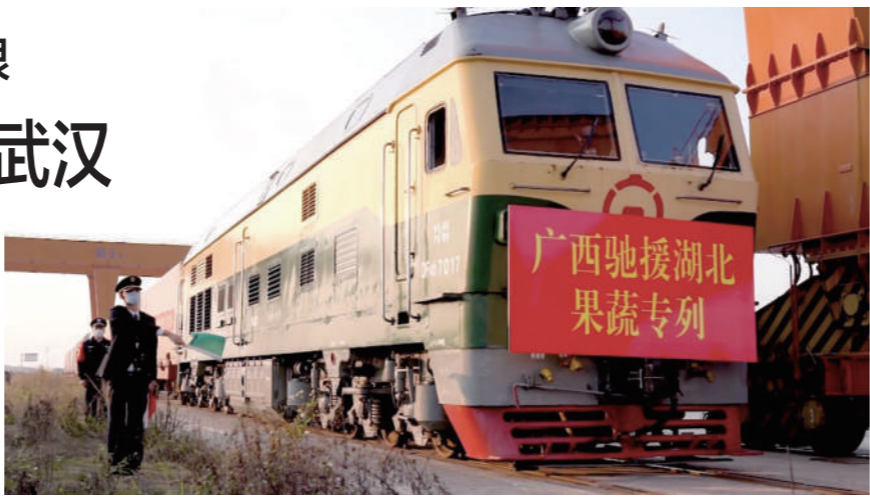
1月30日，广西首趟驰援湖北果蔬专列从南宁发出。

南宁货运中心南宁南货运营业所所长覃芳说，南宁国际铁路港是西部陆海新通道重要节点，也是广西唯一的一级铁路物流基地，广西周边乃至东盟进