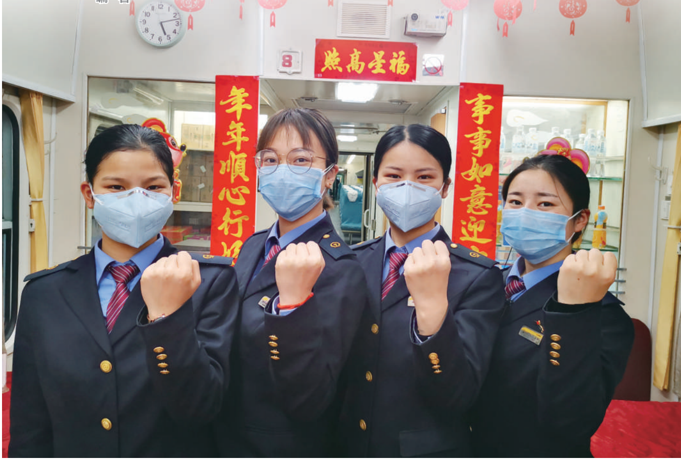
▲武汉加油!中国加油!面对突如其来的疫情,南宁客运段迅速启动疫情防控应急预案,列车工作人员做好安全防护,坚守岗位,服务旅客保障安全。

铁路人!到!疫情面前,集团公司干部职工群情激昂,把疫情防控和抓好安全生产作为当前最重要的任务,落实各项防控措施,确保春运安全稳定。不管是奋战在客运一线的列车员、客运员、机车乘务员、动车机械师、公安干警,还是做好车站车辆卫生消杀、铁路运输设备维护等后勤保障的工作人员,都舍小家,为大家,默默坚守岗位,以昂扬斗志投入这一场疫情防控阻击战中。今日,本报推出专题报道,讲述运输一线宁铁干部职工的“战‘疫’故事。”——编者