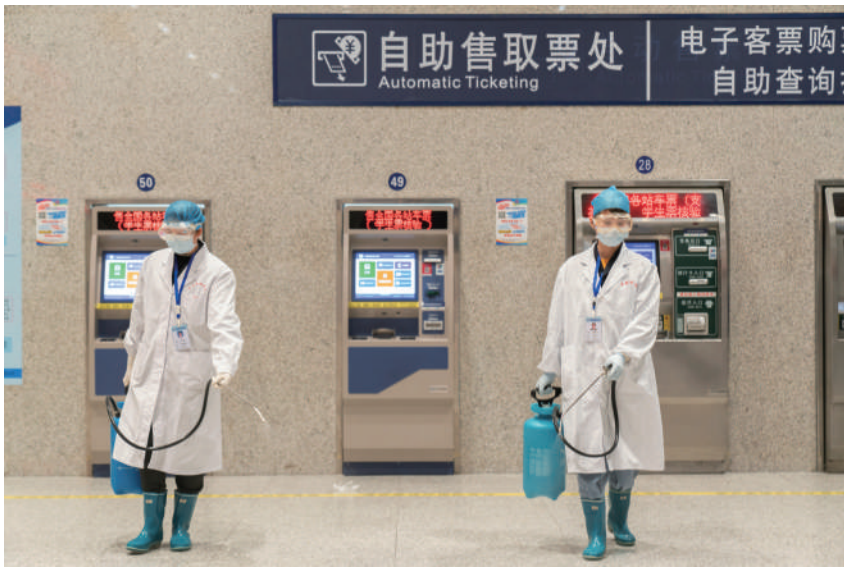
▲1月29日22时,集团公司疾控所医务人员来到柳州站,对车站进行全方位预防性消毒防疫。