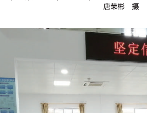
▲面对疫情,桂林车务段党委迅速行动,组建党员突击队,做好疫情防控工。