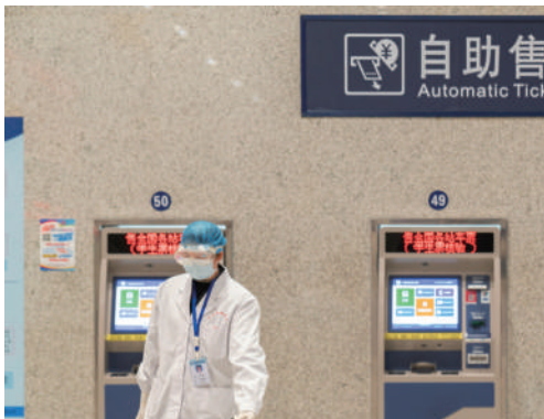
▲坚定信心,众志成城,坚决打赢疫情。