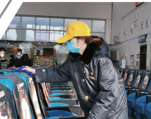
▲南宁机务段组织人员对机车驾驶室进行消毒。