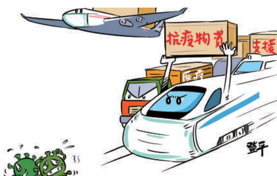
抗疫物资在路上 吴登平 作

呵，你看！ 抗疫的英雄在武汉集结， 八方的物资驰向鄂中， 北京的故宫依然雄伟， 武汉的长江依然万里碧波， 泰山的日出炫丽磅礴， 丽江的古城依然如昨。 从东到西， 从南到北， 亿万户人家， 亿万盏灯火。 创造奇迹， 初心不改； 温馨祥和， 福佑中国！