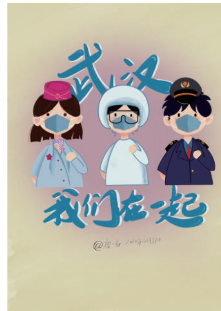
出行路上，铁路人与您同在。 唐一志 作